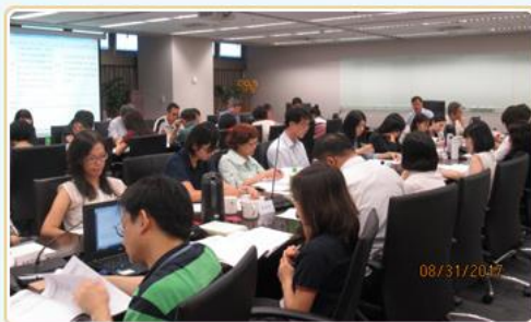
本局召開機關檔案風險管理作業與推動實施方式研商會議

風險無所不在，如何讓檔案趨吉避凶，請看本文介紹機關檔案風險管理。期讓各級檔案管理人員具備風險意識，進而落實檔案風險管理。